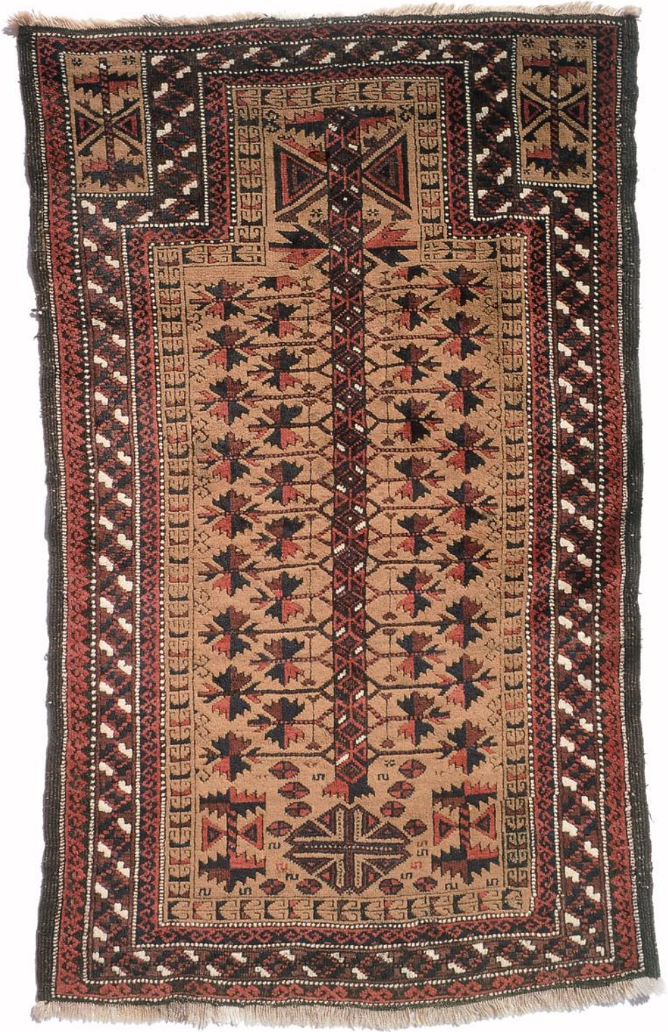
Belutch Kaudani, 154 x 91, antik